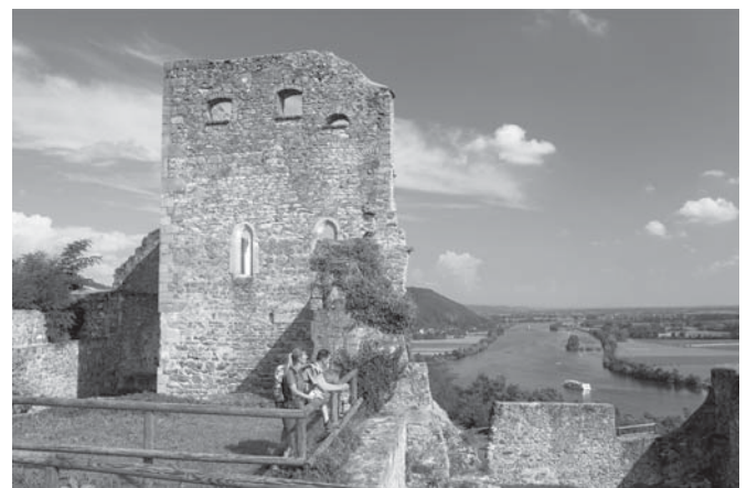
Die Burgruine Donaustauf eröffnet einen wunderbaren Blick ins Donautal.

Unter www.landkreis-regensburg.de können im Prospektshop (Menü Freizeit/Tourismus) die Wanderkarten kostenlos bestellt oder heruntergeladen werden; Kontakt: Tourismusbüro Landkreis Regensburg, Tel. 0941 4009-495, tourismus@landratsamt-regensburg.de , www.burgensteige.de