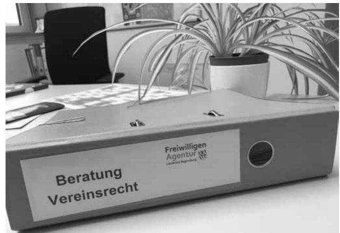
Die Freiwilligenagentur des Landkreises bietet ab sofort eine kostenlose Erstberatung zu Fragen des Vereinsrechts an.

Ansprechpartnerin für das neue Angebot: Dr. Gaby von Rhein, E-Mail: gaby.vonrhein@lra-regensburg.de , Telefon 0941 4009-305